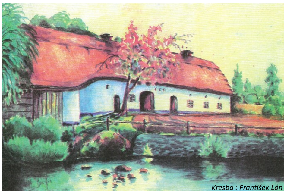
Kresba : František Lón