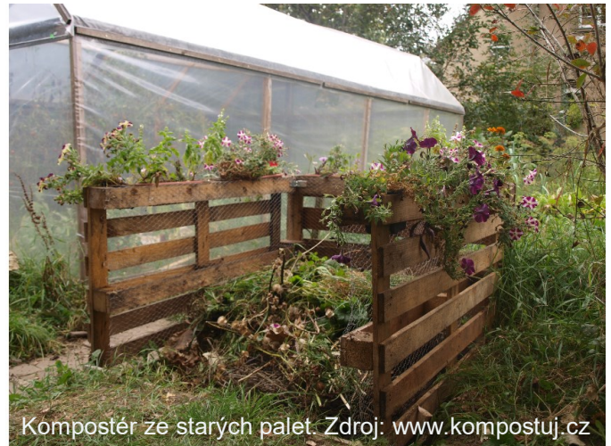
Kompostér ze starých palet.

Ze stávajícího ekonomického hodnocení celého systému (- 100 tis. Kč) zatím vyplývá, že největší finanční ztrátu dlouhodobě způsobuje systém svážení a zpracování bioodpadu (cca 50 tis. Kč). Tato ztráta se bude do budoucna s ohledem na rostoucí ceny za zpracování bioodpadu ještě prohlubovat. Žádáme tedy občany, aby využívali kompostéry a nezapomínali na možnosti kompostování na vlastních zahrádkách. Vzniklý kompost pak můžete použít jako přírodní hnojivo. Příkladem finančně nenáročného řešení je např. kompostér ze starých palet.