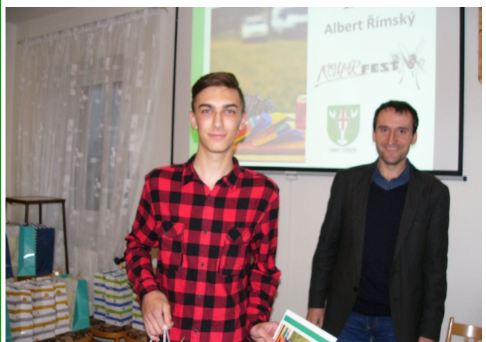
Vítěz fotografické soutěže - Komárfest 2017